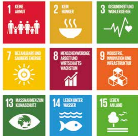
Grafik: Vereinte Nationen; 2018 ENGAGEMENT GLOBAL