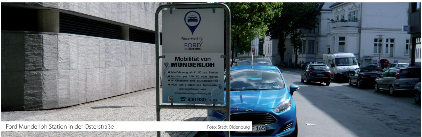
Ford Munderloh Station in der Osterstraße

Wird ein Antrag positiv beschieden, erhält die Antragstellerin/der Antragsteller von der Bewilligungsstelle einen Bewilligungsbescheid. Der Bewilligungsbescheid kann mögliche Auflagen und Bedingungen für die Zuschussgewährung festsetzen. Im Falle einer Zuwendung wird diese als nicht rückzahlbarer Zuschuss in Form einer Anteilsfinanzierung zur Projektförderung gewährt.