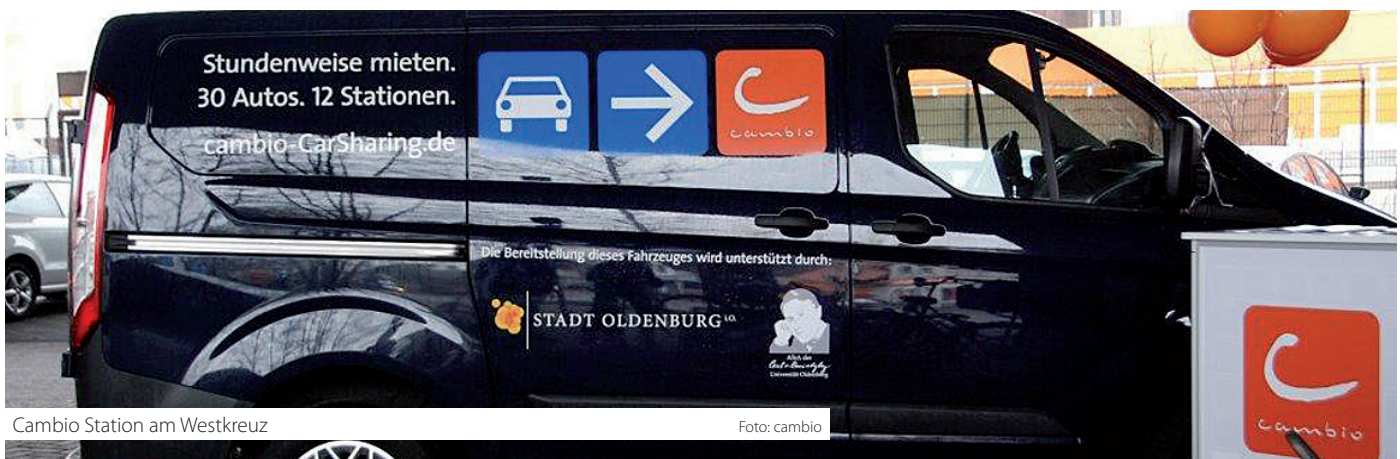
Cambio Station am Westkreuz