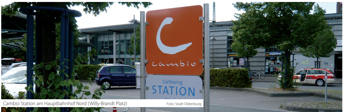
Cambio Station am Hauptbahnhof Nord (Willy-Brandt Platz)

Es ist im Sinne der Stadt Oldenburg, dass Carsharing im Allgemeinen beworben wird, um die Bekanntheit dieser Mobilitätsform zu steigern. Es sollte sich dabei nicht um Werbung für einzelne konkrete Carsharing-Anbieter handeln. Diese Art der Informationsverbreitung kann von der Zuwendungsgeberin im eigenen Ermessen durchgeführt werden.