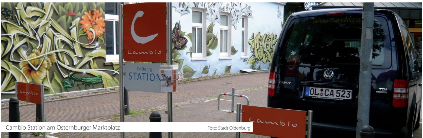
Cambio Station am Osternburger Marktplatz

Generell verpflichtet sich jede Zuwendungsempfängerin/jeder Zuwendungsempfänger, bei Veröffentlichungen (Jahresberichte, Programme, Kataloge, Prospekte, Flyer und Ähnliches.) in geeigneter Form auf die finanzielle Förderung durch die Stadt Oldenburg hinzuweisen und entsprechende Belegexemplare zusammen mit dem Verwendungsnachweis vorzulegen.