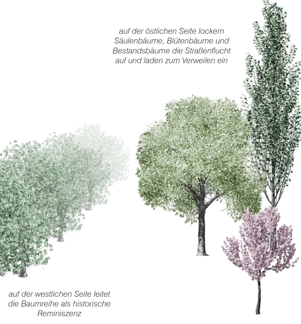
auf der westlichen Seite leitet die Baumreihe als historische Renaissance