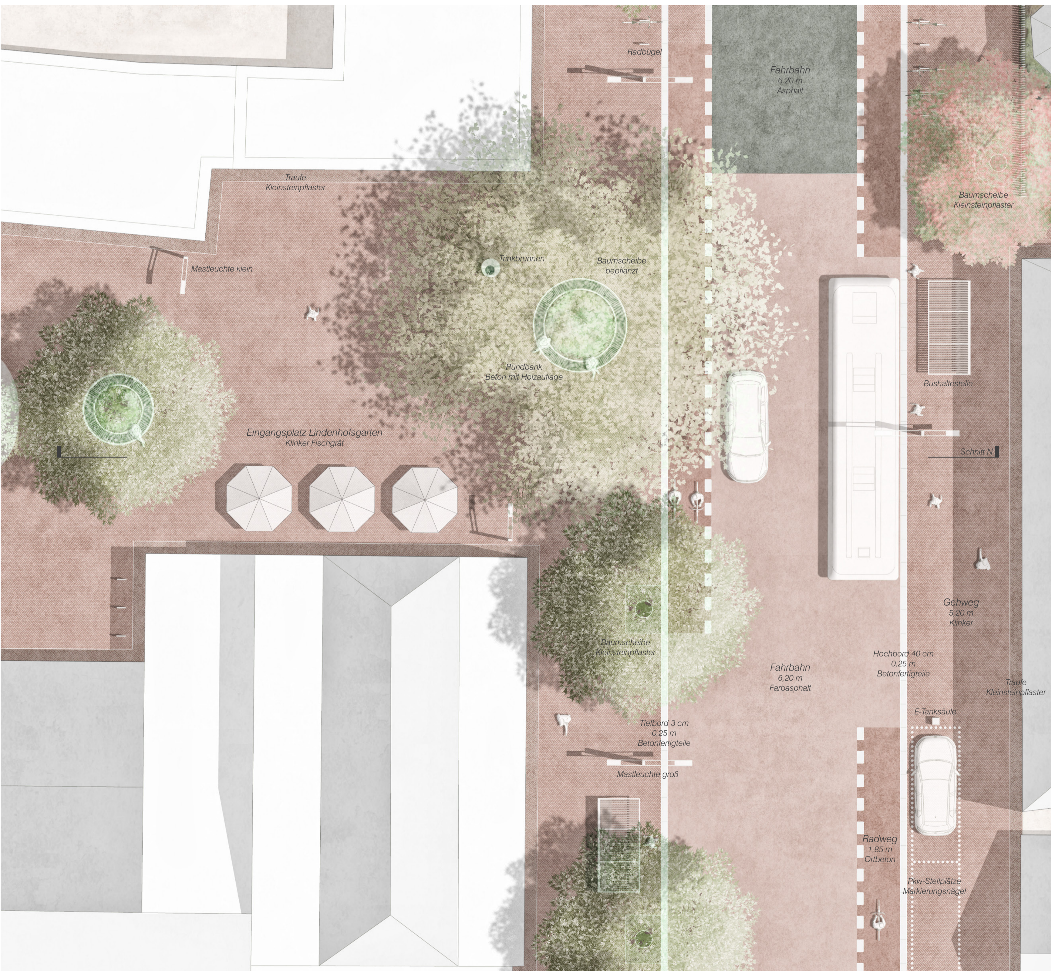
Detail & Schnitt Nord M 1:100