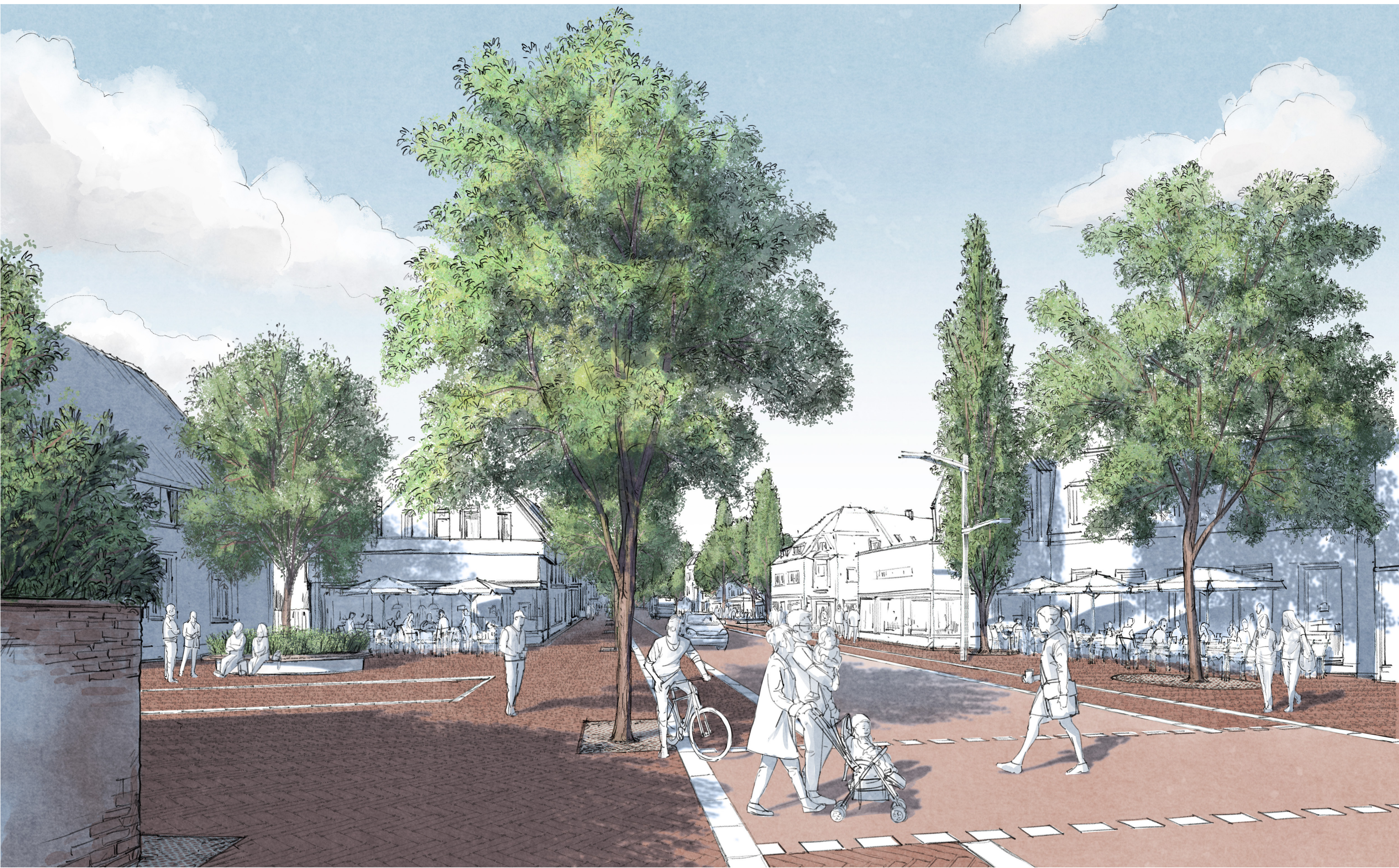
Blick in die Nadorster Straße am Aufstapplatz an der Ehrenstraße