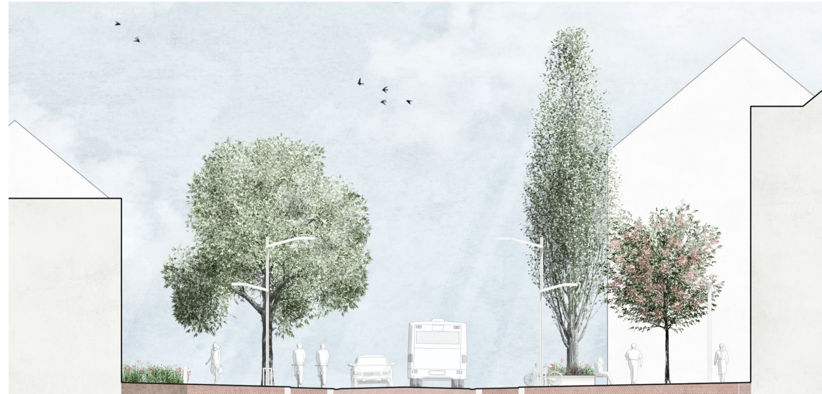
Vorgarten 2,80m Streifen Grün/Stein/Grün Gehweg 4,50m Kürker Trottoir 3,0m Oberweg Fahrbahn 6,20m Fahrschicht Radweg 1,80m Kürker Trottoir 3,0m Oberweg Kleiner Platz 8,00m Kürker Trottoir Kleinstadtbreite