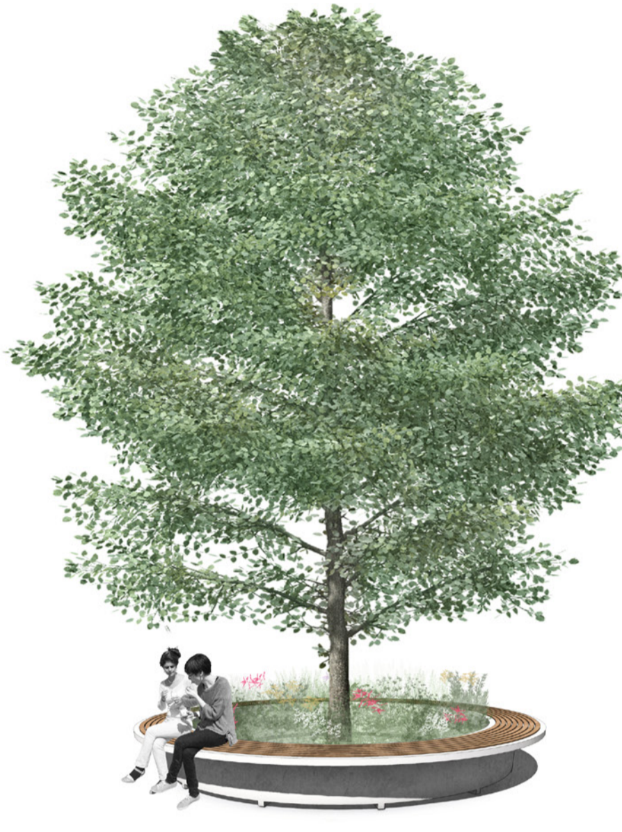
auf der östlichen Seite lockern Säulenbäume, Blütenbäume und Blütenbäume der Straßenflucht auf und laden zum Verweilen ein