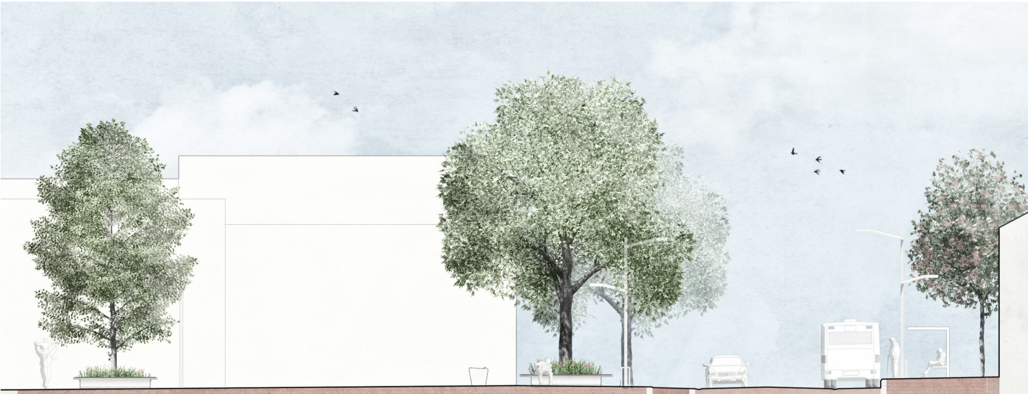
Engangsplatz Lindenholergarten Kürker Radweg 1,80m Oberweg Trottoir 3,0m Oberweg Fahrbahn 6,20m Fahrschicht Haltestelle 7,80m Oberweg Handbreit 40cm 0,25m Betonoberfläche Gehweg 2,00m Kürker Trottoir Kleinstadtbreite