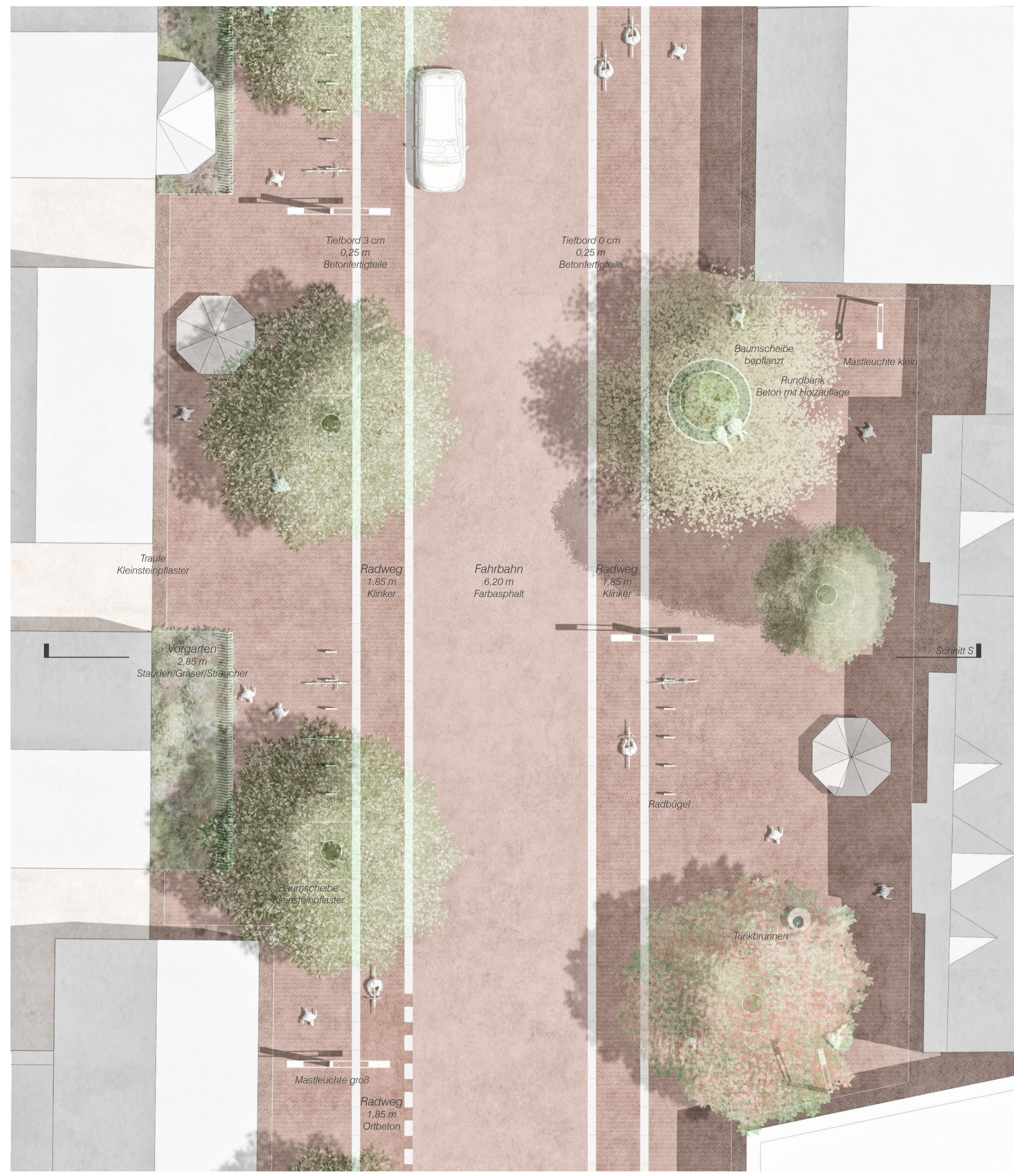
Detail & Schnitt Süd M 1:100