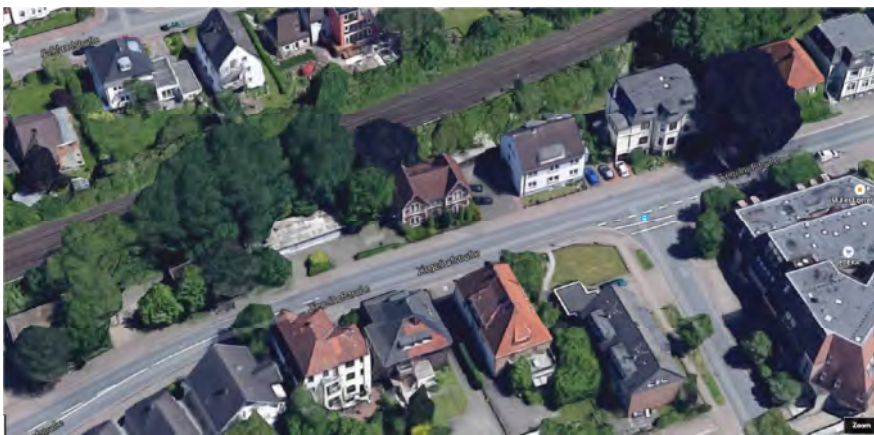
Friedhofsweg 57 Gruppen baulicher Anlagen