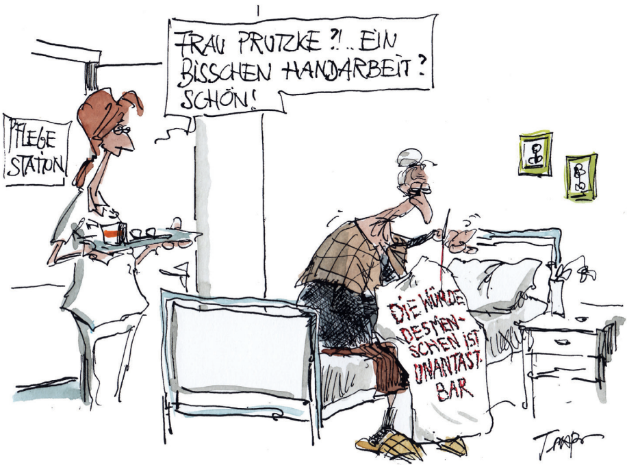
Cartoon von Thomas Plafmann