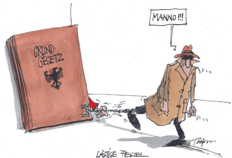
Cartoon von Thomas Pläßmann

Akte an und führe sie? Wie verschaffe ich mir Übersicht über Abläufe und Fristen? Welche Versicherungen sind sinnvoll für Betreuende und Betreute? Umgang mit Krisensituationen, Tipps und Tricks bei Fallstricken in der Praxis sollen erörtert und ausgetauscht werden. Erfahrungen aus der Betreuungsarbeit sind erwünscht. Idee des Workshops ist es, eine Werkzeugkiste aus den Erfahrungen der Betreuenden für den Betreuungsalltag zu packen.