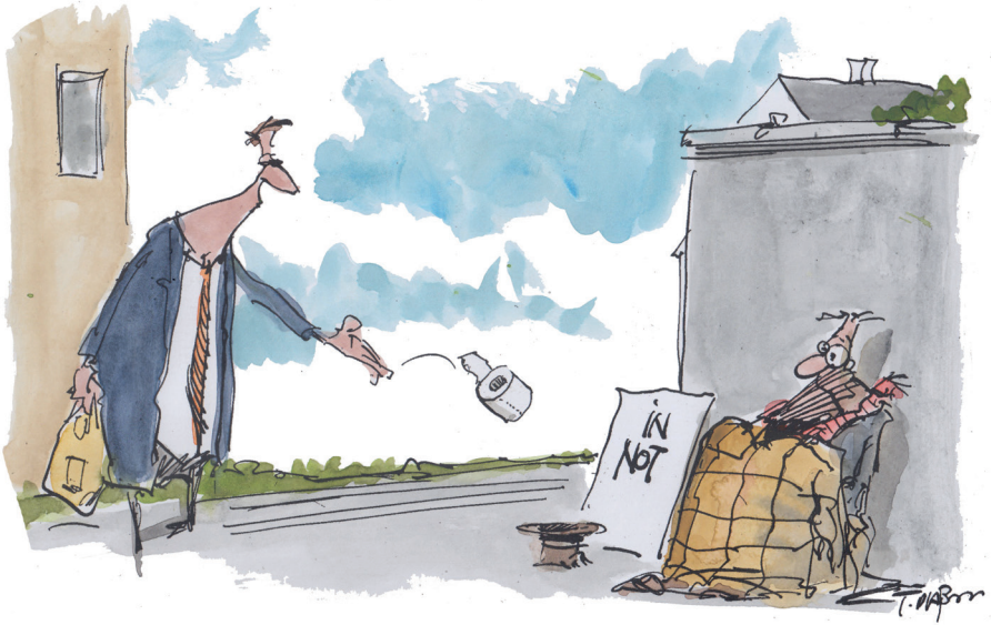
Cartoons von Herrn Thomas Plassmann - Copyright bei den Diakonischen Werken Baden und Württemberg