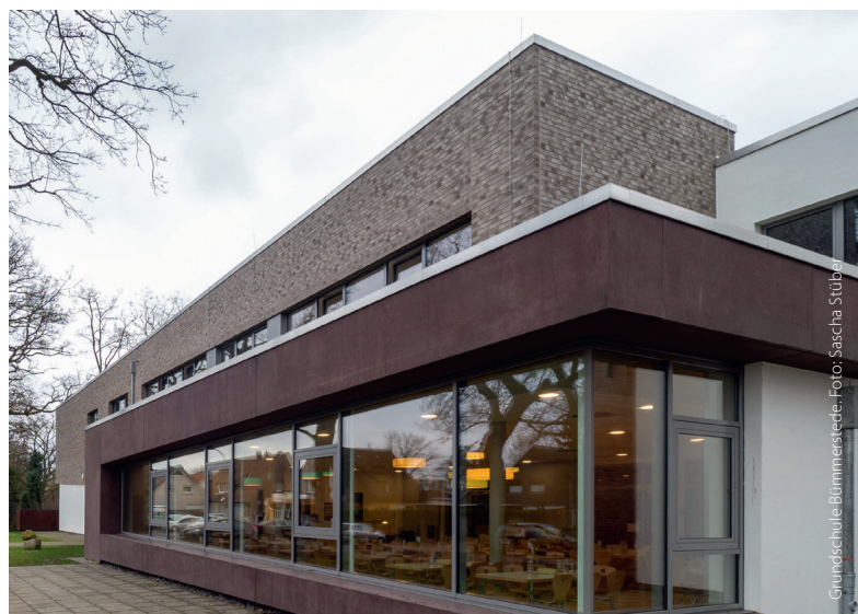
Grundschule Bümmerstedde.