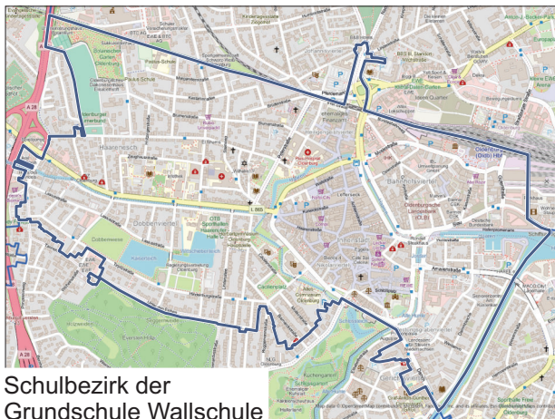
Schulbezirk der Grundschule Wallschule